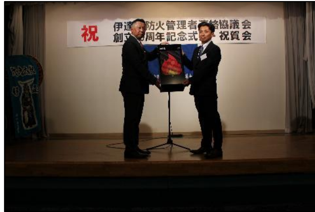
【受贈後の記念撮影】

今後は、各種行事や事業所の避難訓練時などに活用し、防火意識の向上につなげてまいります。