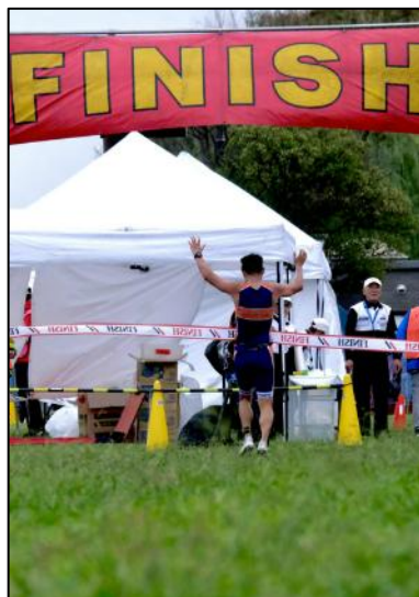
【昨年のトライアスロン大会の様子】