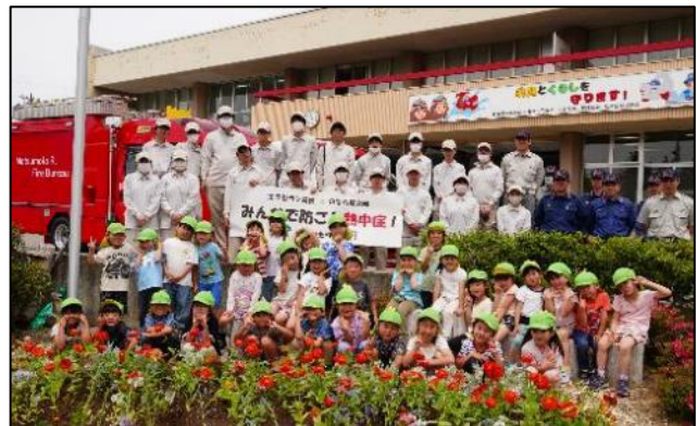
【広報活動後の記念撮影】