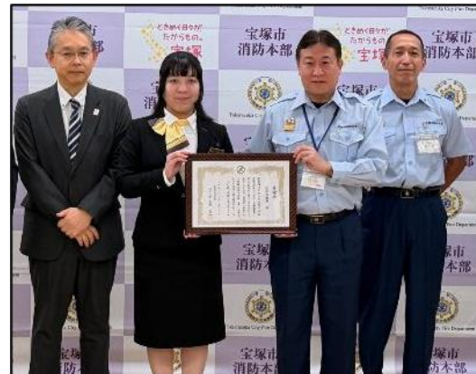
【感謝状贈呈後の記念撮影】