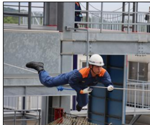
【展望デッキと同じ高さからの様子】