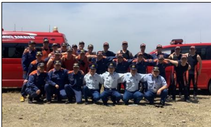
【訓練後の記念撮影】