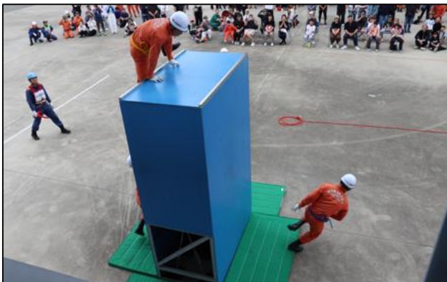
【栈敷席からの様子】