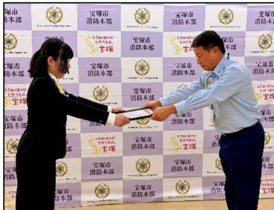
【感謝状贈呈の様子】

消防協力者の救命への高い意識と傷病者への配慮ある行動により、尊い命が救われたことに対し、心から敬意と感謝の意を表します。