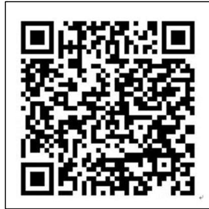
【鶴岡市消防本部公式Instagram】