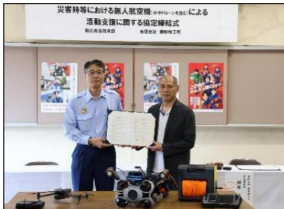
【締結後の記念撮影】

今後も、合同訓練を重ね、官民が連携した体制を強化し、地域の安全・安心を支える消防力の強化に努めてまいります。