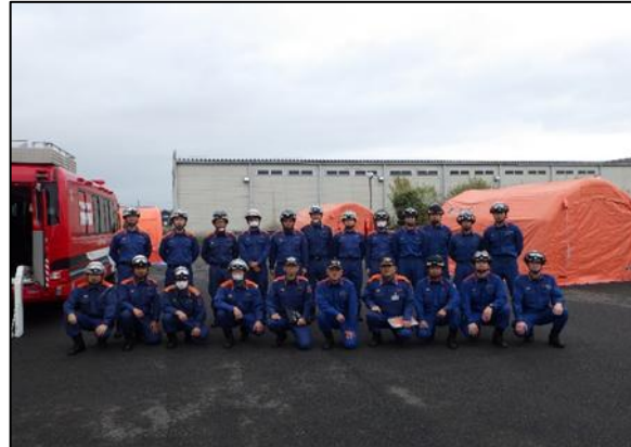
【訓練後の記念撮影】