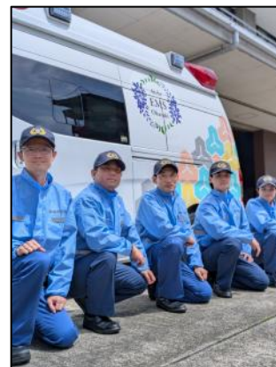
【発隊式後の記念撮影】