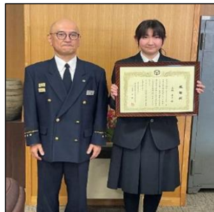
【贈呈後の記念撮影】