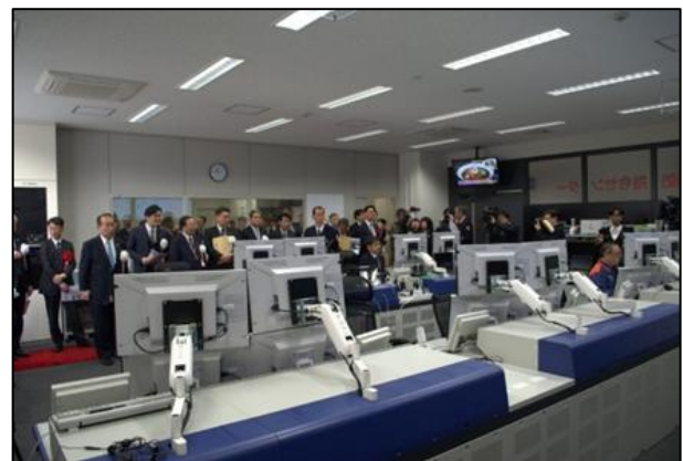
【運用を開始した指令センター】