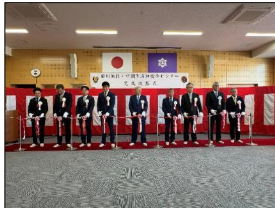
【完成披露式の様子】