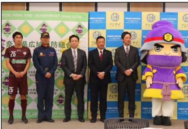
【ディスカッション後の記念撮影】

今後も、共同開発したサプリメントを活用し、住民の皆さまの安心を守る隊員の体調管理と安全確保に努めてまいります。