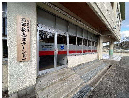
【運用を開始した西部救急ステーション】