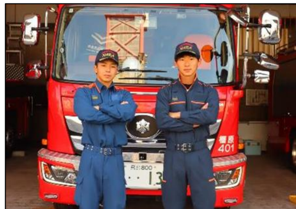
【新たに導入した新活動服（右）】