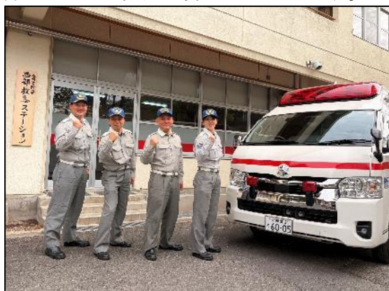
【増隊した日勤救急隊】

今後も、地域に根ざした施設を有効に活用し、住民の皆さまの安全・安心を確保するため、救急体制のさらなる充実に取り組んでまいります。