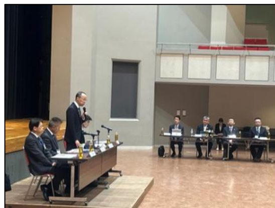
【財政委員会の様子】